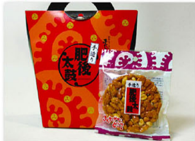
肥後太鼓 4枚入 518円