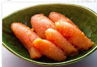
赤酒めんたい じっくり120時間漬け込んだ、赤酒仕込の「辛しめんたい」です。