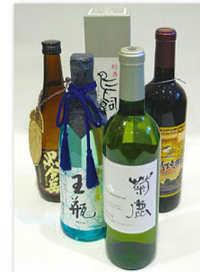
熊本ワインを中心に球磨焼酎や限定の日本酒を含め、熊本ならではのお酒やおつまみをご用意しております。