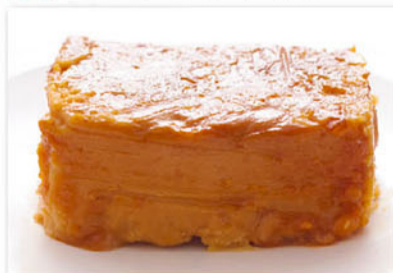
山うにとろふ 燻桜(いぶしさくら) 80g×2個 864円

◆営業時間 物販/ 9:00~19:00 (12~2月期は 9:00~18:00) ※一部店舗は9:30開店 飲食/ 11:00~22:00