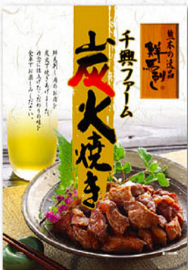
馬肉の炭火焼き 1袋(100g) 640円