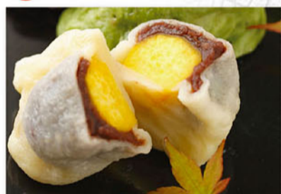
安納芋いきなり団子 1個(約100g) 200円