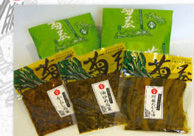
「阿蘇高菜」を始め阿蘇の特産品をご用意しております。