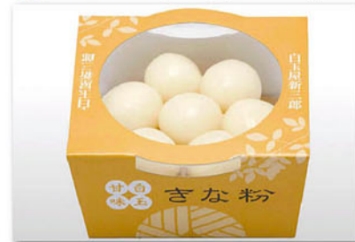
白玉甘味 白玉7玉+餡子orみつ 367円