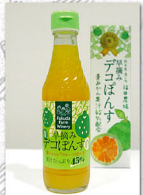
デコぼんす 250ml 596円