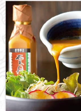
雲丹そ〜す 1本(120ml) 1,080円