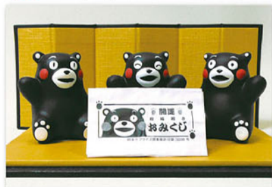
くまモンおみくじ 1個 378円