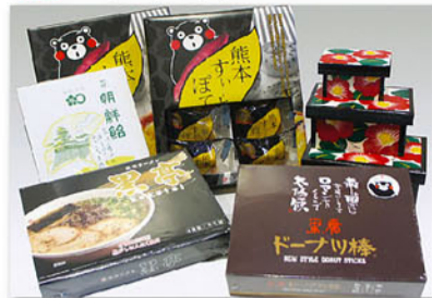
熊本県下各地のお土産や特産品等を幅広く取り揃えました。 ●熊本伝統菓子とお土産菓子の「熊本銘菓ゾーン」 ●熊本ラーメンなどの特産品、肥後象嵌などの伝統工芸品