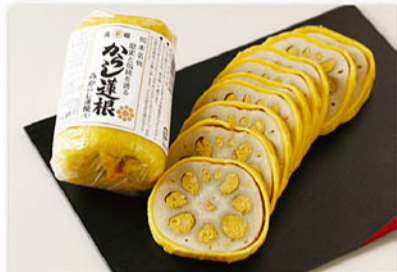
からし蓮根(中) 1本(280g以上) 1,080円