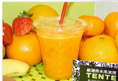
各種生ジュース 1杯(400ml) 300円~