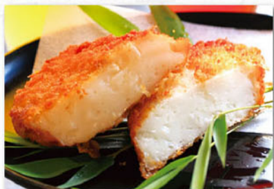
オランダ揚げ 1枚 215円