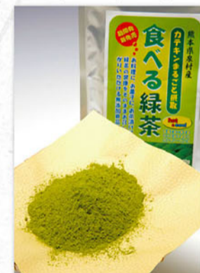
食べる緑茶 1袋(100g) 864円