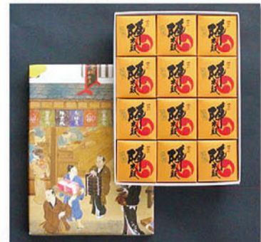
銘菓『誉の陣太鼓』 4個入~24個入 713円~4,126円