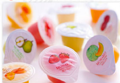
豆乳フルーツプリン ミックス 1口サイズ×20個 1,404円