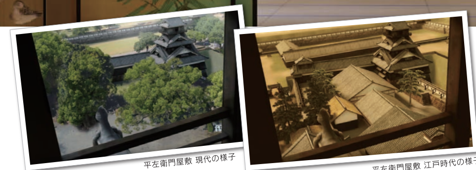
平左衛門屋敷 現代の様子

圧倒的な映像クオリティや 学術価値に注目！！ まるで江戸時代にタイムスリップしたかのような 世界が味わえます！！