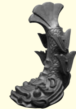
小天守に新しく設置される鯨 しやちほこ